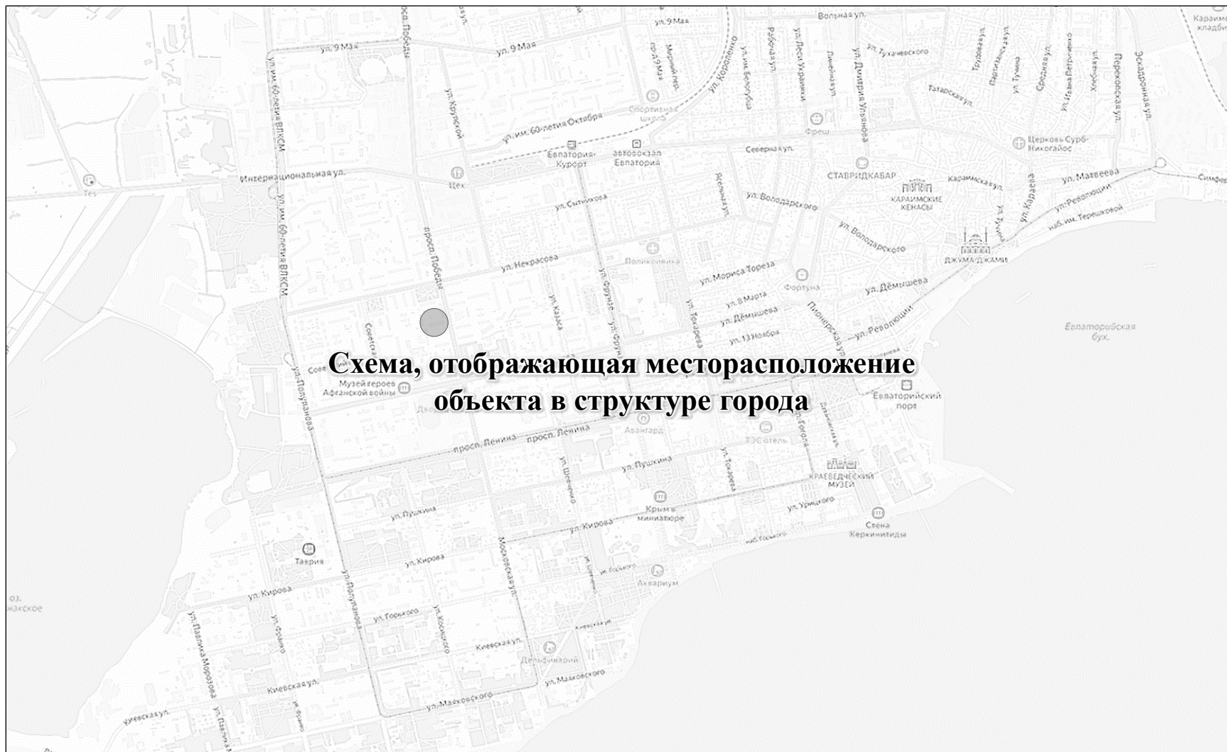
Схема, отображающая месторасположение объекта в структуре города