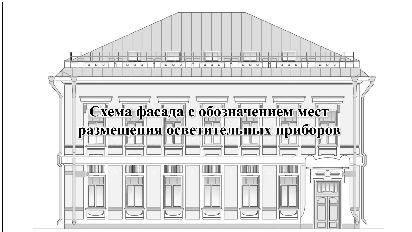
Схема размещения архитектурно-художественной подсветки