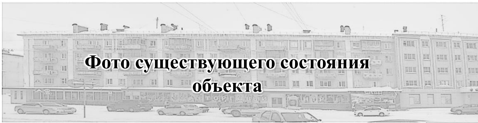
Схема визуального восприятия фасадов